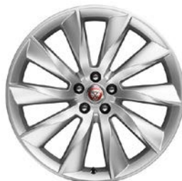
8. TURBINE 20" pro F-TYPE T241864 T2R1866