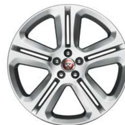
10. TEMPLAR 20" pro F-PACE T4A2308