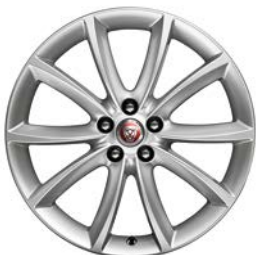
7. PROPELLER 19" pro F-TYPE T2R1860K T2R1862K