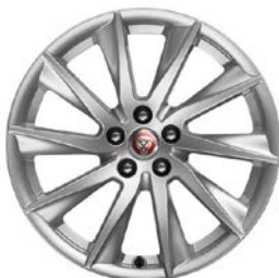
6. VELA 18" pro F-TYPE C2P18511 přední T21858K zadní