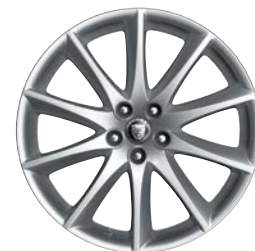
5. ALEUTIAN 19" pro XJ C2D4499K přední C2D4500K zadní