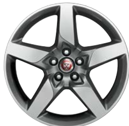
2. STAR 19" pro XE T4N13261 přední T4N13262 zadní