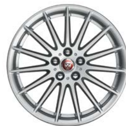
9. LIGHTWEIGHT 18" pro F-PACE T4A1085