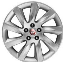
3. TURBINE 17" pro XF T2H4951