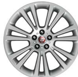
4. AXIS 19" pro XF T2H2206