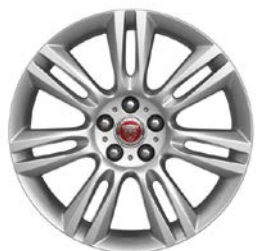
1. MATRIX 18" pro XE T4N1677

Představujeme některé z kompletních sad (vyobrazeny pouze disky kol), které Vám můžeme nabídnout za zvýhodněnou cenu. Nabídka platí pouze do vyprodání zásob.