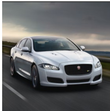
JAGUAR XJ 2012

Pán automobilového tvorstva. Vzrušující kombinace vysokého výkonu, krásy a jízdního pohodlí. Jaguar XJ je dokonalou volbou za každé situace, bez ohledu na to, zda se sami chopíte volantu, nebo se raději pohodlně usadíte na zadní sedadlo a necháte se vézt. Zažijte nejvyšší úroveň evolučního vývoje.