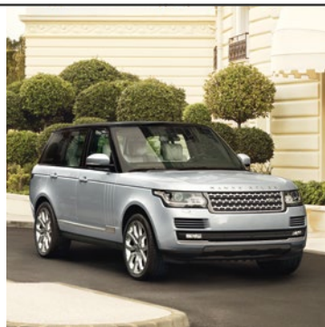
RANGE ROVER 1970

I evoluce si občas vezme inspiraci od ostatních. Range Rover je designová ikona, která každého inspiruje svou špičkovou technikou. Vždy nabízí maximální výkon – v jakémkoli terénu a za jakékoli situace. Nechte se políbit múzou evoluce.