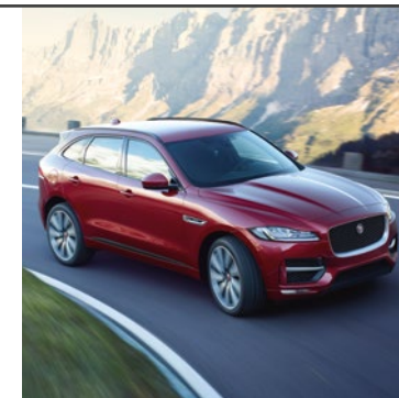
JAGUAR F-PACE 2016

Nezbytným předpokladem úspěšné evoluce je vysoký výkon. Nový Jaguar F-PACE ztělesňuje kultivovanou DNA značky Jaguar a nabízí legendární výkon, dechberoucí jízdní vlastnosti a zároveň jedinečný luxus. Proč nevyzkoušet náš osvědčený recept na to, jak obstát v evoluci?