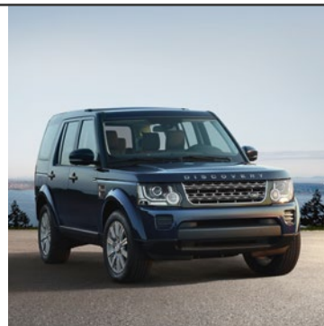
LAND ROVER DISCOVERY 1989

Automobil všestranný jako samotná příroda, který se všude cítí ve svém žvilvu. Jeho vzhled i výkonnostní parametry procházejí neustávajícím vývojem. Špičkovou terénní průchodnost doplňuje pohodlný a kvalitně zpracovaný interiér. Tento Land Rover je stejně všestranný jako příroda – a také jako vy.