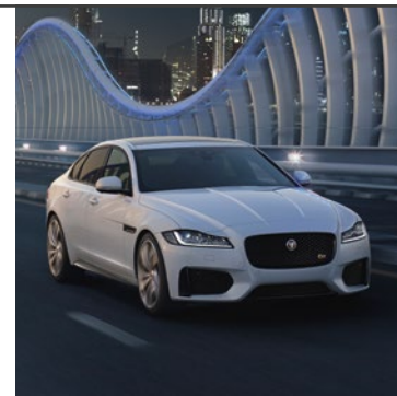
JAGUAR XF 2015

Evoluce občas proběhne hladčeji, než by se dalo očekávat. Příkladem může být nový Jaguar XF. Jeho bezkonkurenční kombinace designu, dynamiky a kultivovanosti už léta vyvolává všeobecné nadšení. U tohoto modelu se evoluce skrývá v detailech.