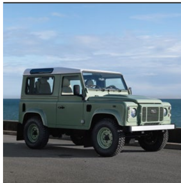
LAND ROVER DEFENDER 1948

Na počátku byl Defender, prapůvodní nositel genů charakteristických pro vozy s pohonem všech kol. Žádná překážka ho nevyvede z rovnováhy. Nic ho nezastaví. Defender není nic menšího než ztělesnění dobrodružství. Podívejte se, jak to všechno začalo.