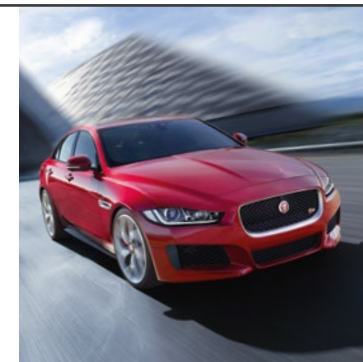
JAGUAR XE 2016

Jaguar XE od základu nově definuje kategorii sportovních limuzín. Pod aerodynamickým designem dotaženým do posledního detailu najdete moderní a lehkou hliníkovou konstrukci a nejmodernější technologie. Model XE představuje ve své třídě doslova nový živočišný druh.