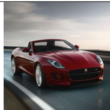
JAGUAR F-TYPE CABRIOLET 2014

Jaguar F-TYPE Cabriolet je ukázkou dokonalého souladu mezi formou a funkcí. Jedinečný design se v něm snoubí s vynikajícími jízdními vlastnostmi a bleskurychlými reakcemi. V symbióze s modelem Jaguar F-TYPE Cabriolet zažijte ničím nezkalenou radost s jízdy.