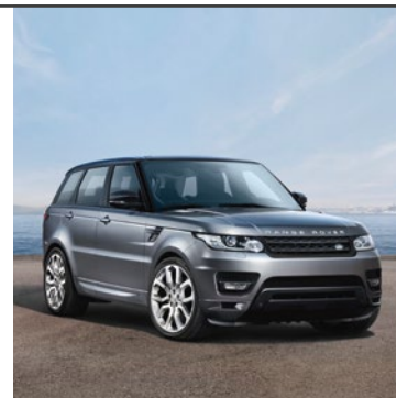
RANGE ROVER SPORT 2005

Naše pocta sportovní stránce evoluce – Range Rover Sport. Průvodce, který vás dovede až na hranice možného. Díky nevídané dynamice na silnici, která se snoubí s legendární průchodností v terénu typickou pro značku Land Rover, se v každém prostředí cítí jako doma. Zažijte sportovní stránku evoluce.