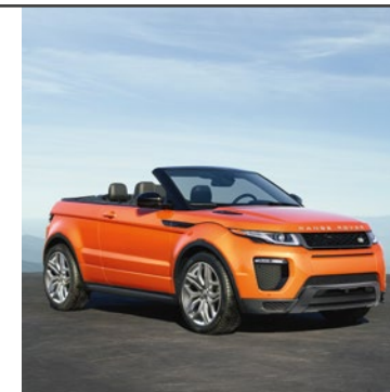
RANGE ROVER EVOQUE CABRIOLET 2016

Modelem Range Rover Evoque Cabriolet vám Land Rover představuje zcela nový živočišný druh. První prémiový SUV kabriolet světa je díky inovativním technologiím jako Terrain Response® a špičkovému informačnímu a zábavnímu systému InControl Touch Pro dokonale připraven na život v městském prostředí. Náš nový živočišný druh vezme město útokem.