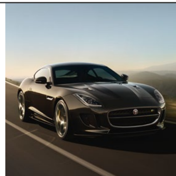
JAGUAR F-TYPE COUPÉ 2014

Jaguar F-TYPE Coupé představuje nejvyšší vývojový stupeň sportovních vozů s pohonem všech kol. Nese všechny charakteristické rysy značky Jaguar. Vrcholného stupně na evolučním žebříčku dosahuje kombinací dechberoucího výkonu a cenami ověřeného designu.