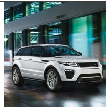
RANGE ROVER EVOQUE 2011

Dokonalé pochopení evoluce. Díky výrazným tvarům, svalnatému charakteru, dynamickým střešním liniím a kompaktním rozměrům se výrazně odlišuje od šedého průměru a jasně ukazuje, že značka Land Rover evoluci rozumí.