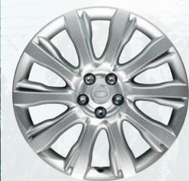
Range Rover, 21 palců