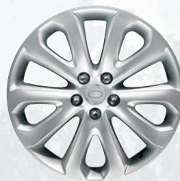
Range Rover, 20 palců