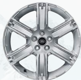
Evoque, 19 palců