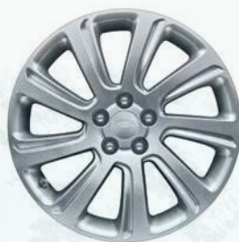
Discovery Sport, 18 palců