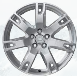
Evoque, 18 palců

Představujeme některé z kompletních sad (vyobrazeny pouze disky kol), které Vám můžeme nabídnout za zvýhodněnou cenu. Nabídka platí pouze do vyprodání zásob.