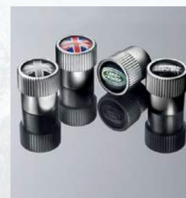
Land Rover-čepicky na ventilky kol v různém designu

Pro informace o cenách kompletních sad zimních kol, prosím, kontaktujte autorizovaného prodejce vozů Land Rover. Sestaví pro Vás nabídku zimních kol dle Vašich požadavků.