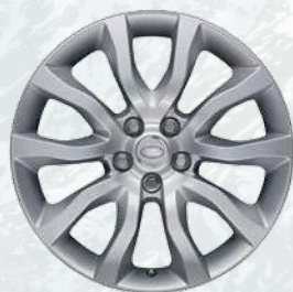
Range Rover Sport, 19 palců