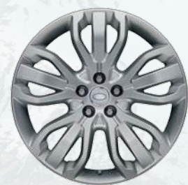
Range Rover Sport, 21 palců