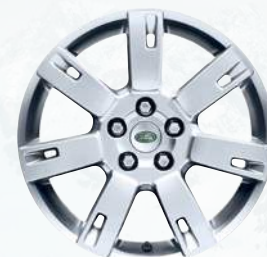
Discovery, 19 palců