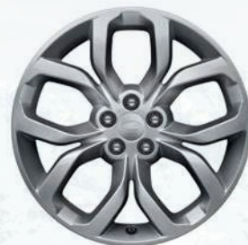
Discovery Sport, 18 palců