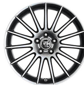
LIBRA 17 PALCŮ XF