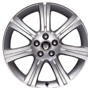
VENUS 18 PALCŮ XF