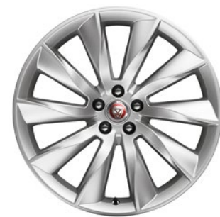
TURBINE 20 PALCŮ F-TYPE

Pro informace o cenách kompletních sad zimních kol, prosím, kontaktujte autorizovaného prodejce vozů Jaguar. Sestaví pro Vás nabídku zimních kol dle Vašich požadavků.