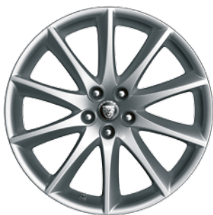
ALEUTIAN 19 PALCŮ XJ