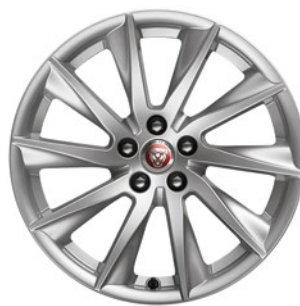
VELA 18 PALCŮ F-TYPE